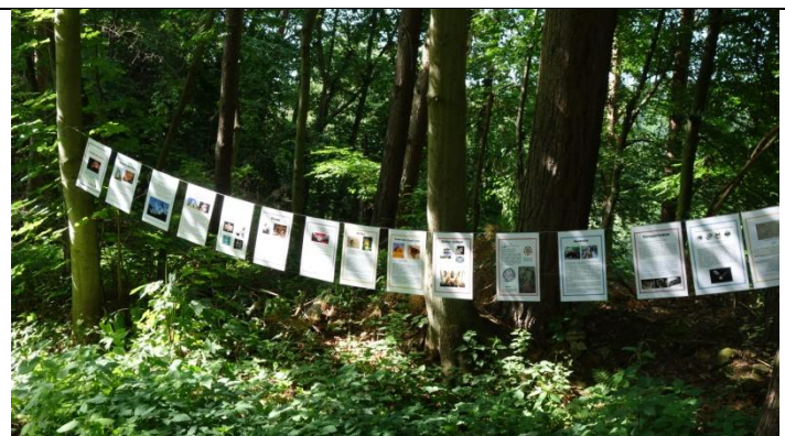
Výstava na provázku Netopýr jako symbol