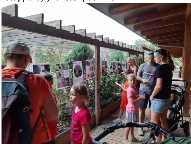
Netopýří noc na Hamru - mobilní naučná stezka

zjistili netopýry rezavé a netopýra nejmenšího. Vypustili jsme zde netopýra hvízdavého z centra města. Zjištěné druhy netopýrů byly zaneseny do NDOP.