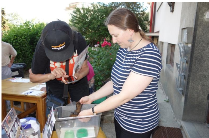
Pochod KČT S ochranáři přírody za netopýry

Stanoviště s netopýry bylo součástí 2 podvečerních pochodů v rámci dlouhodobé kampaně „Člověče, pohni se, než bude pozdě“. Účastníci získávají samolepky netopýrů, které sbírají a vylepují do skládačky.