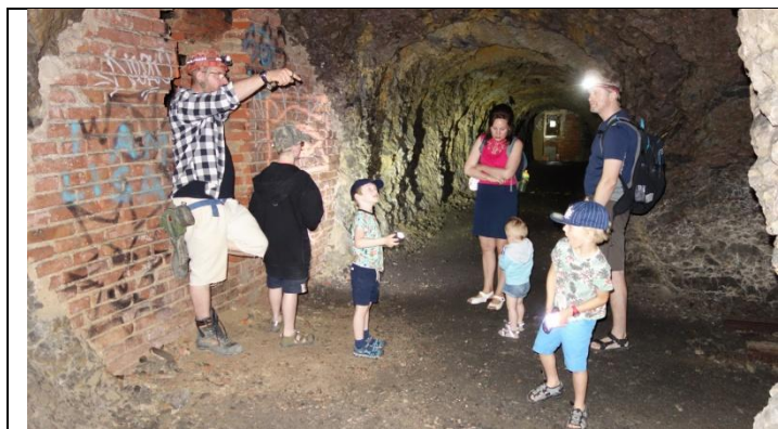
Komentovaná prohlídka branického podzemí

Tradiční akce pořádaná ČSOP. Součástí setkání byla možnost navštívit podzemní štoly. Zájemci se hlásili předem na konkrétní čas vstupu, čímž byl zajištěn plynulý průběh akce. Jeden průvodce zajistil odborný komentář při podzemní exkurzi, druhý zajišťoval přesuny skupin od stanoviště s netopýry do podzemí a zpět, další člověk prezentoval netopýry na stánku. Skupině 12 zájemců jsme umožnili vstup do podzemí v náhradním termínu, včetně prezentace živých netopýrů. Součástí akcí byla mobilní naučná stezka „Netopýří v ČR“ s vědomostním kvízem, za všechny správné odpovědi získali účastníci skládačku o pražských netopýrech a samolepky netopýrů na vylepení do skládačky. V Šárce mohli shlédnout výstavu na provázku Netopýr jako symbol.