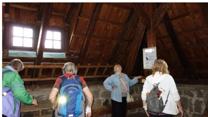
Senioři v Týnci nad Sázavou u kolonie netopýrů velkých