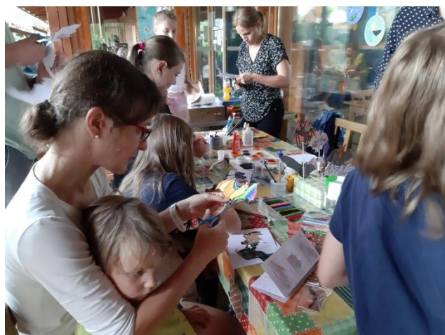
Netopýří noc na Hamru - dílnička