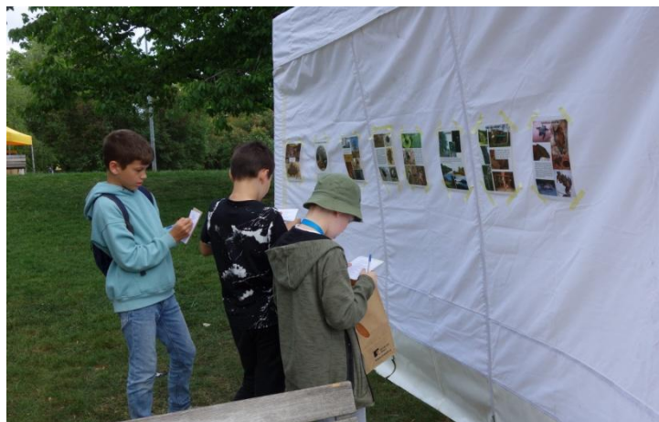
Mikroklima – mobilní naučná stezka a vědomostní kvíz