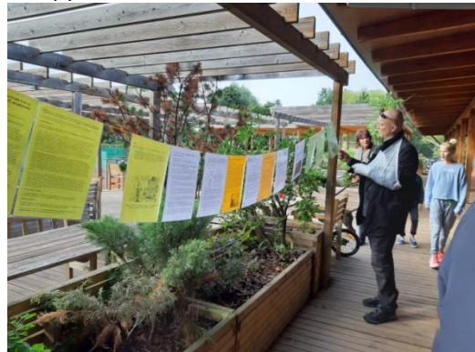
Netopýří noc na Hamru – o covidu a netopýrech