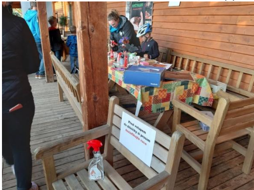
Netopýří noc na Hamru v době covidové