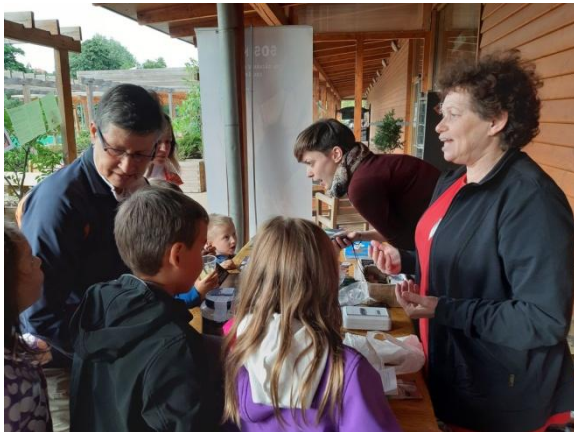
Netopýří noc na Hamru – prezentace netopýřů a poradna