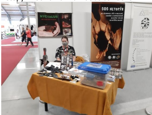
FOR PETS stánek s netopýři