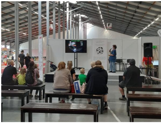
FOR PETS přednáška o netopýrech