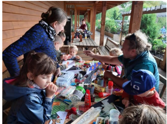
Netopýří noc na Hamru – dílnička