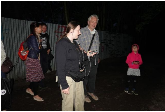
Večerní exkurze s ultrazvukovým detektorem