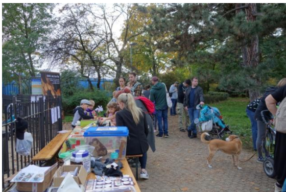
Den stromů s ježkem a netopýry v Heroldových sadech