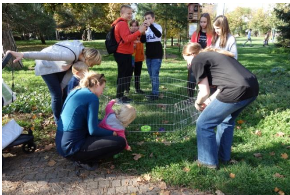
Den stromů s ježkem a netopýry v Heroldových sadech