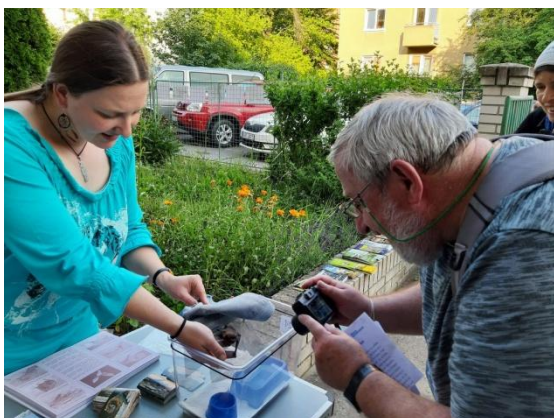
V cíli pochodu KČT S ochránci přírody za netopýry