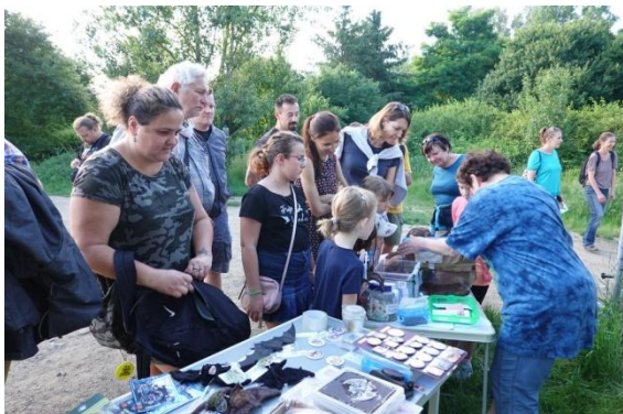
Setkání u meandru Botiče