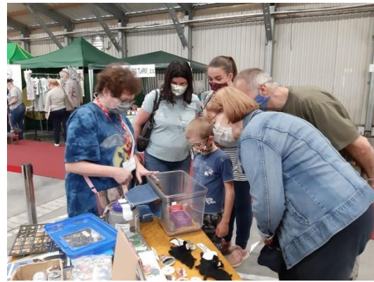
FOR PETS v rouškách rozdělený na sektory