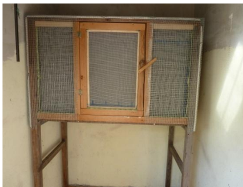
Stěny s dvojitým pletivem