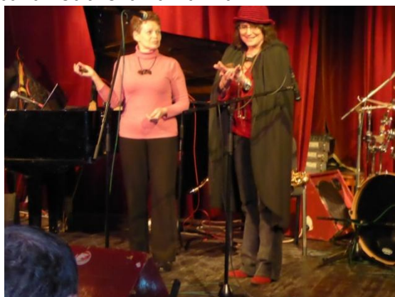
Činna u Kaštanu – úvodní slovo