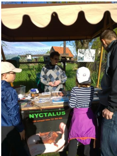
Úklid Trojmezí 2016

Tyto akce byly pořádány ve spolupráci s dalšími organizacemi , např. SEV Toulcův dvůr, Nadací na ochranu zvířat, FN Motol, MŠ Markušova, MC Klubíčko, United Islands. Základem těchto akcí jsou krátké přednášky a prezentace živých ochočených netopýrů pro menší skupiny návštěvníků opakující se po celou dobu akce. Akce probíhají venku nebo v místnosti.