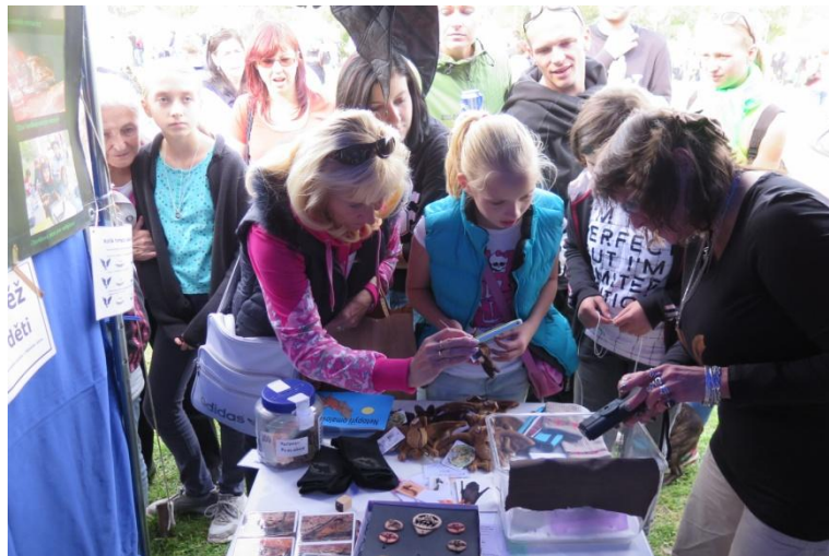
Den Země na Pankráci 2015