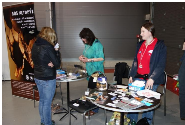
FOR PETS 2016