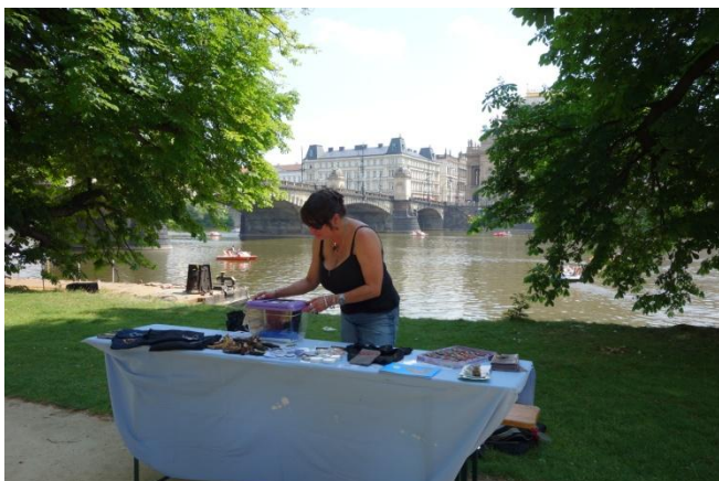
United Islands 2016