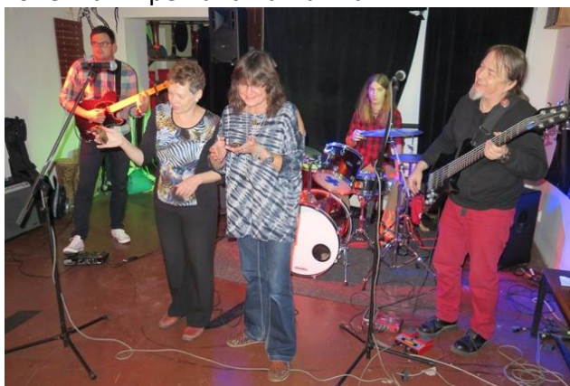
Vekauf Musique v Už jsme doma